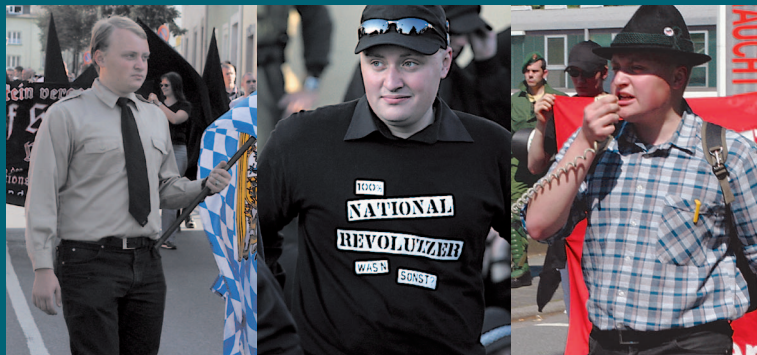
Derselbe Neonazi aus München auf thematisch unterschiedlich ausgerichteten rechtsextremistischen Demonstrationen

Hier können Sie Broschüren anfordern, die Ihnen weiteren Aufschluss über Symbole und Codes der extremen Rechten geben und anhand derer Sie die »Wölfe im Schafspelz« unter Umständen enttarnen können.